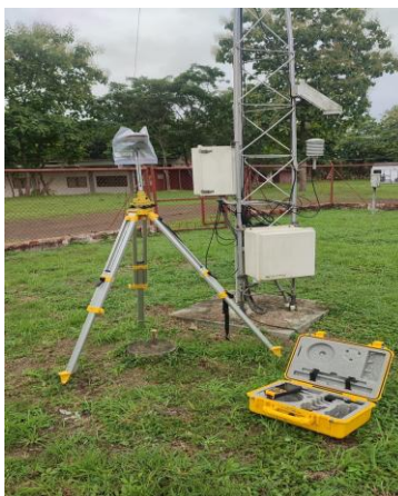
Foto 1. Se muestra el punto geodésico ubicado en Tucumén que se utilizó para dar coordenadas y elevación real a los puntos con GPS ubicados en el Hogar Bolívar para el levantamiento del polígono solicitado.