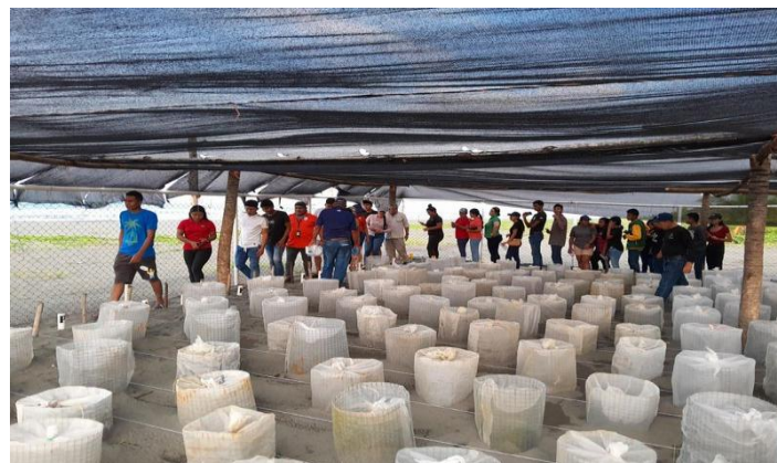
Foto 2. Estudiantes y profesor en vivero junto a encargado del vivero