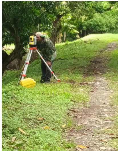
Foto 2. Se muestra momentos en que personal del CIHH hace el levantamiento topográfico del terreno del Hogar Bolívar con la estación total Geomax Zip 20R.