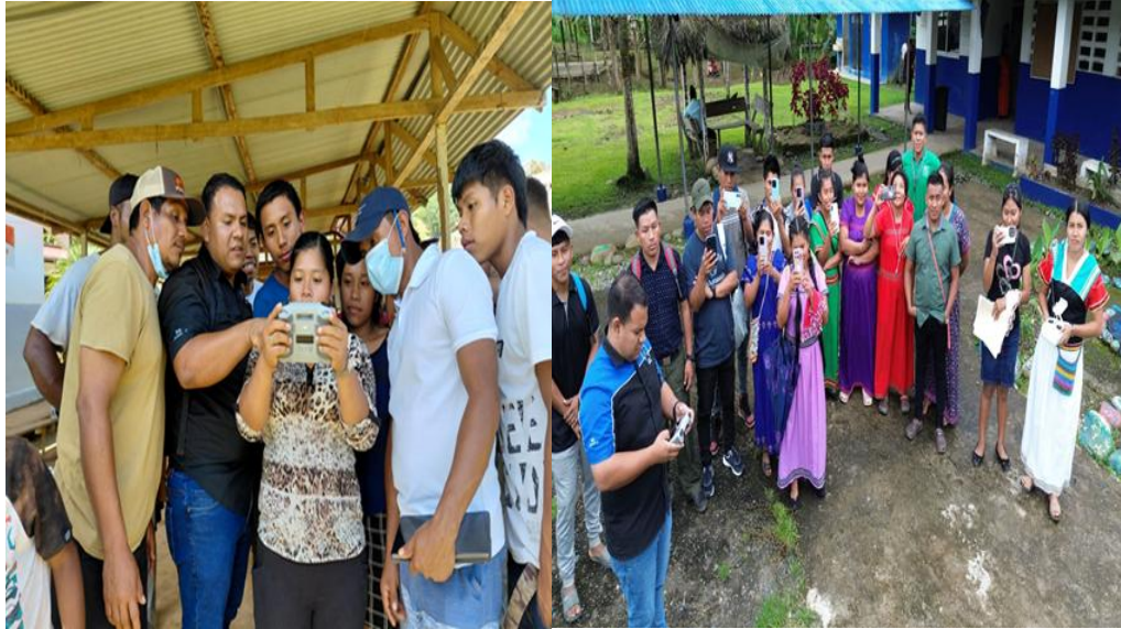
Foto 3. Explicación sobre el monitoreo de bosques con tecnología de drones