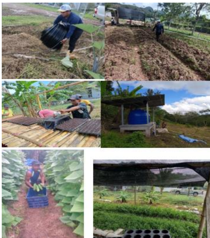
Visitas técnicas y capacitaciones.

Por su impacto tangible, su carácter replicable y su integración de infraestructura, capacitación y sostenibilidad, el Sistema de captación de agua para riego de hortalizas se consolida como un proyecto insignia de extensión universitaria , que demuestra la contribución efectiva de la universidad al desarrollo sostenible de comunidades rurales y a la gestión responsable de los recursos naturales.