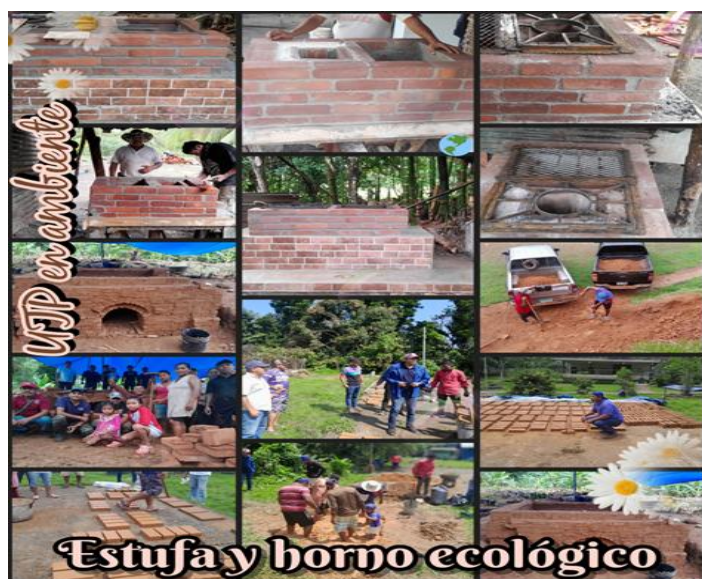
Foto 2. Construcción y capacitación a pobladores de la región

Estudiantes y docentes de la UTP impulsan soluciones energéticas para centros educativos de difícil acceso