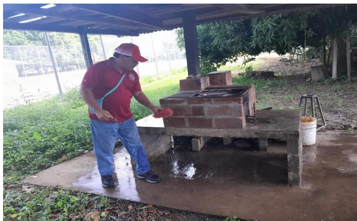
Foto 1. Estufa construida en el Centro Regional de Bocas del Toro